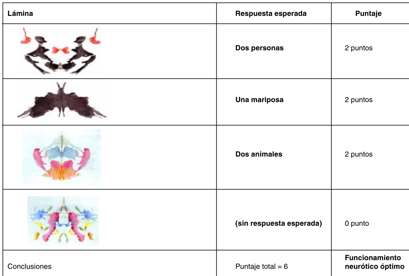
Tabla 1. Respuestas en el Test de Rorschach y puntaje del caso

El test de los colores de Max Lüscher 5 es una prueba proyectiva que evalúa indicadores emocionales que influyen en la capacidad adaptativa y describe algunas características estables de la personalidad. En una primera etapa, el evaluado debe priorizar preferencias entre 8 colores presentados; y en una segunda etapa debe priorizar entre variaciones de los colores azul, verde, rojo y amarillo. La elección cromática de la paciente presentó indicadores de estabilidad emocional en la lámina de variaciones: regulación afectiva (azul), regulación cognitiva (verde) dentro de rangos normales, con agresividad controlada (rojo) y leve aumento de la impulsividad (amarillo) (Figura 1).